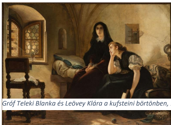
Gróf Teleki Blanka és Leövey Klára a kufsteini börtönben, 1867

A REFORMÁCIÓ ÖRÖKSÉGE 2025 | Múzeumi esték 5.